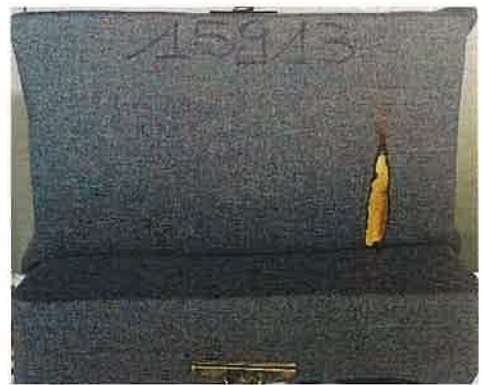
Il primo innesco sulla provetta