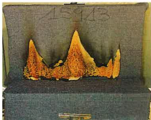
Il terzo innesco sulla provetta

NOTE: ATTENZIONE PROVA NON UTILIZZABILE AI FINI DELL'OMOLOGAZIONE