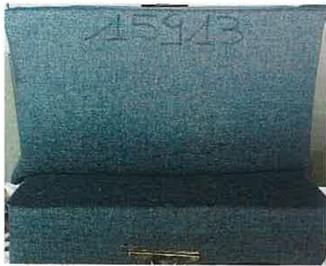
La provetta prima della prova