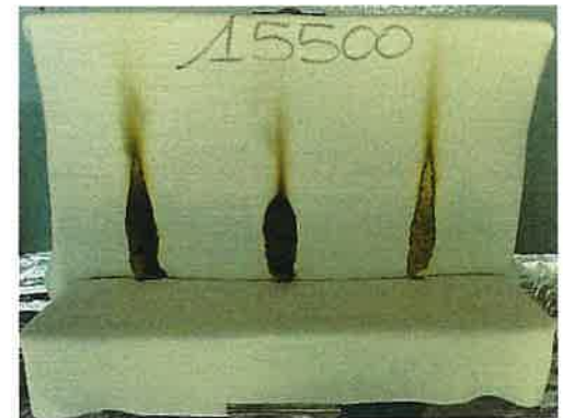
Il terzo innesco sulla provetta

NOTE: ATTENZIONE PROVA NON UTILIZZABILE AI FINI DELL'OMOLOGAZIONE