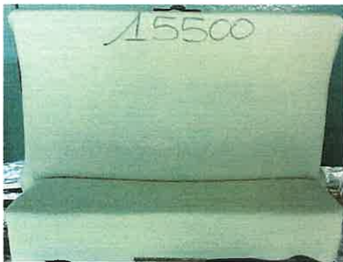
La provetta prima della prova