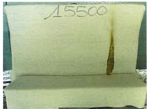
Il primo innesco sulla provetta