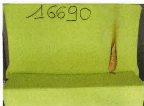
Il primo innesco sulla provetta