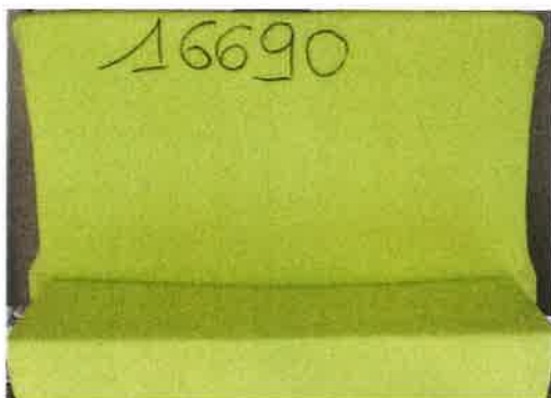
La provetta prima della prova